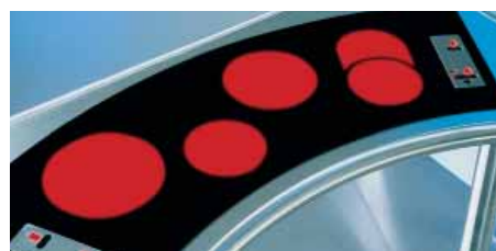
Individuelle Möglichkeiten des Kochfelddesigns